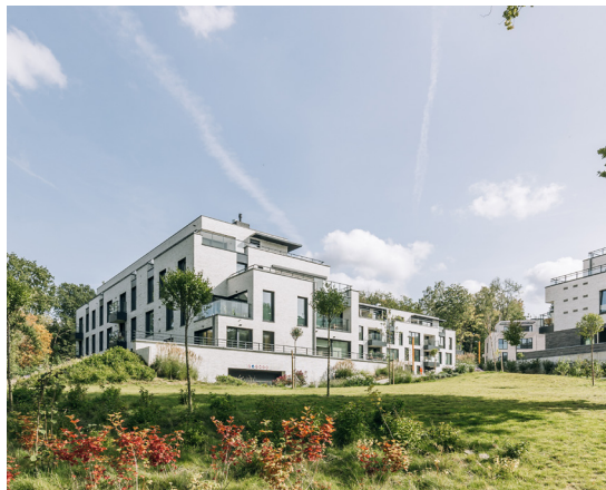
Les Promenades d’Uccle, Brussel