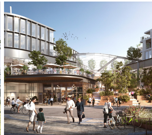
Le Côté Verre, Namen

In 2023 leverde BESIX RED het volgende project op: