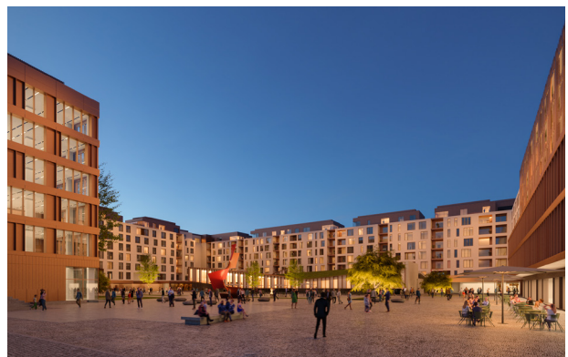
Parque Oriente, Lissabon