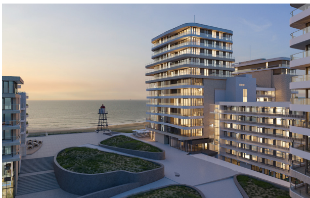
Kijkduin, Den Haag